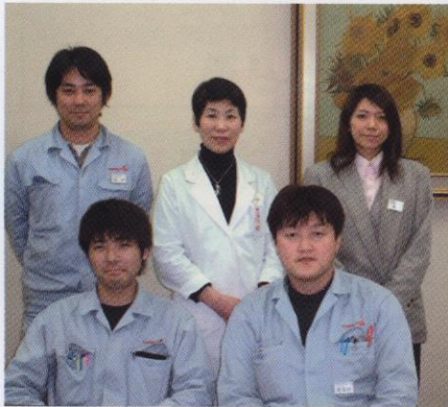
前列右から喜多川室長代理、門坂さん 後列右から堺さん、岡看護師、川戸さん