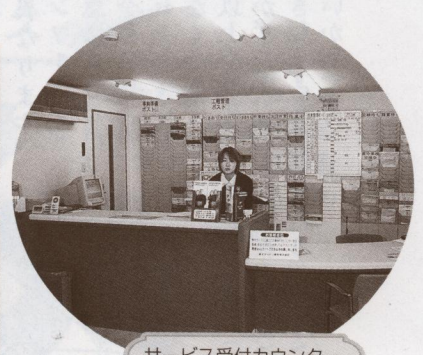
サービス受付カウンター