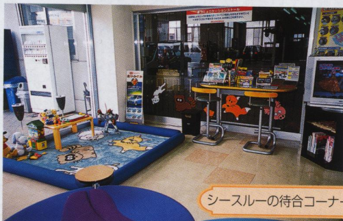
シースルーの待合コーナー