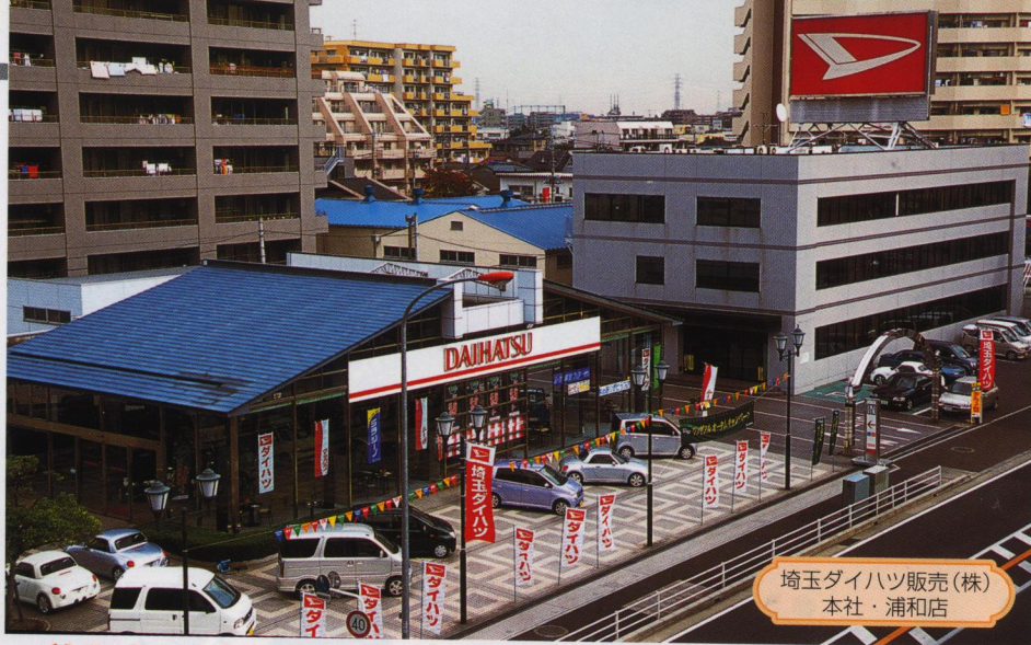
埼玉ダイハツ販売(株) 本社・浦和店

私たちは今、『お客様に感謝し、明るく楽しい職場をつくろう』 をモットーに、『Rainbow Plan 21 (中期5か年計画)』 に取り組んでいます！