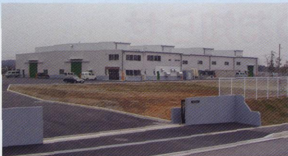
滋賀水口第二工場