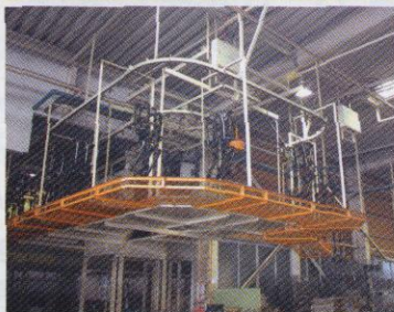
電着塗装装置 (滋賀)