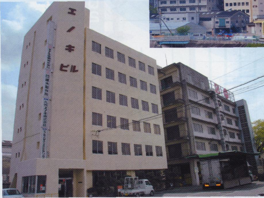
大阪府吹田市江の木町31番28号

当社がある吹田市は、大阪府の中北部に位置し、地域の北側は、なだらかな千里丘陵で占められ、南側は淀川、安威川、神崎川や、千里丘陵を源流とする川から運ばれた堆積物で作られた平地になっており、1960年代、千里丘陵に千里ニュータウンが建設されて広大なベッドタウンとなりました。1970年には日本万国博覧会が開催され、鉄道道路が整備。この時に開業した地下鉄御堂筋線（北大阪急行線）江坂駅の付近に榎木製作所の