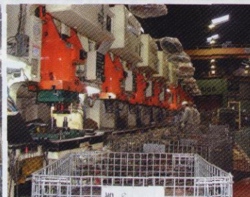
タンデムC型プレスライン (本社)