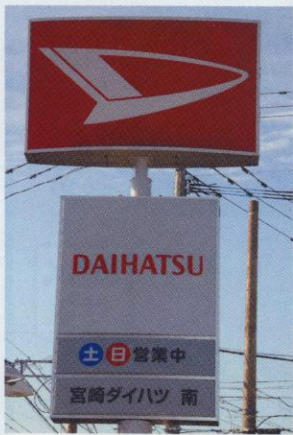
▶ 昨年9月にオープンした宮崎南店