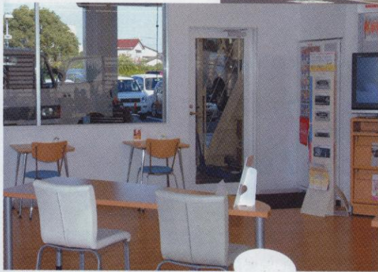
▲ 宮崎南店サービスコーナー