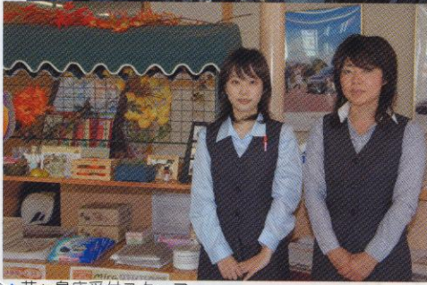
▲花ヶ島店受付スタッフ