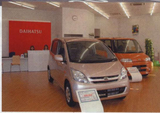
▲ 宮崎南店ショールーム