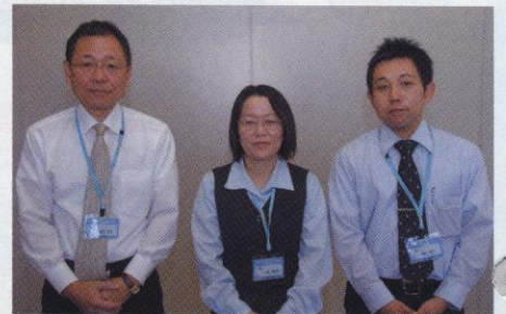
▲ 本社総務室スタッフ

九州の南部に位置する「宮崎」は、大陸からの寒気を防いでくれる九州山脈と太平洋の暖流（黒潮）のおかげで、冬でもほとんど雪が降らず、平均気温が17℃前後と1年を通し非常に温暖な気候です。暖かいだけでなく、日照時間が約2100時間、快晴日数が年平均54日と非常に太陽に恵まれた地域でもあります。全国的に曇りがちな冬季においても晴天が多く、日照時間は日本海側の約2倍にもなります。そのような気候もあり、たくさんのプロ野球・Jリーグのチーム、社会人・大学などのアマチュアチームがキャンプ地として宮崎を訪れています。県内各地に、競技場、グラウンド、コート、体育館などさまざまな種目に対応した良質の施設があり、最近では屋内多目的施設の整備も進むなど、「スポーツランド宮崎」を目指して、さらにスポーツ施設の充実が図られています。現在ではプロアマあわせて延べ約8万6千人ものスポーツ選手が宮崎でキャンプを行っています。