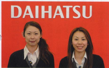
▲青森観光通り店女性スタッフ

常にお客様第一という考えで仕事をしています。気軽にお客さまに立ち寄っていただけるような、おしゃれで楽しいお店の雰囲気づくりを心がけて、先輩たちも今日まで店舗をつくってききました。どこの店づくりも「ちょっとおしゃれでとってもあたたかい」というコンセプトに徹しています。