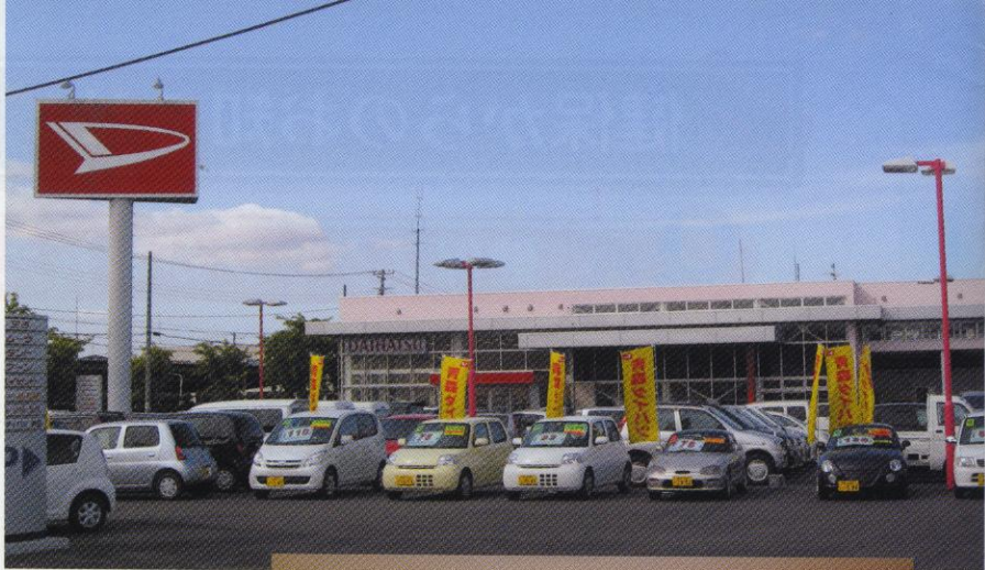
▲弘前神田店： 2007年12月オープン