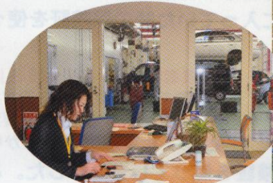
▲ショールームからサービス 工場がよく見渡せます