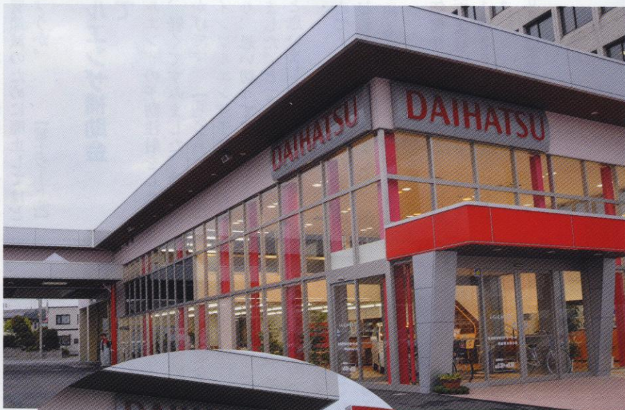
▲青森観光通り店：2008年3月オープン