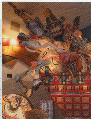
▶弘前ねぶた…弘前観光会館展示