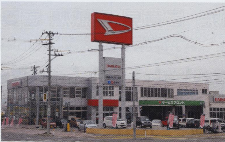
▲本社・青森石江店