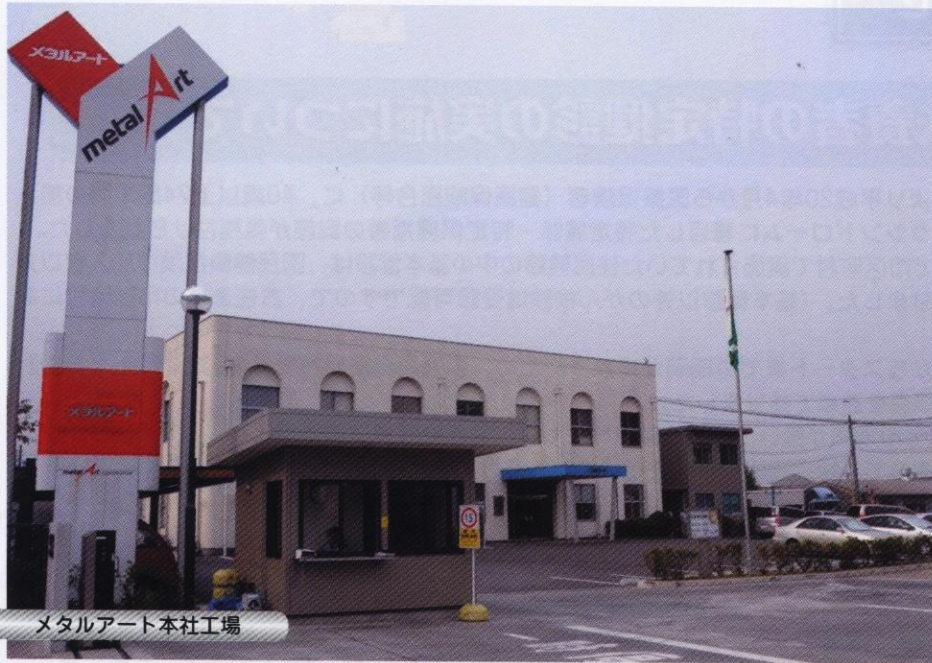
メタルアート本社工場