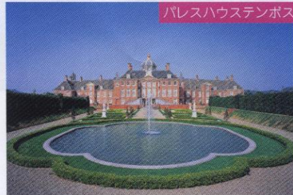
パレスハウステンボス

皆さん是非ご利用ください。 お申込みは 健康保険組合保健事業係まで。 TEL 06 - 6371 - 1453 E-mail mail@daihoken.jp