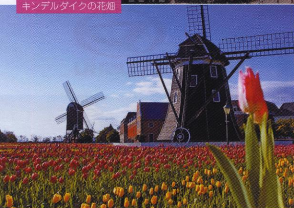
キンデルダイクの花畑