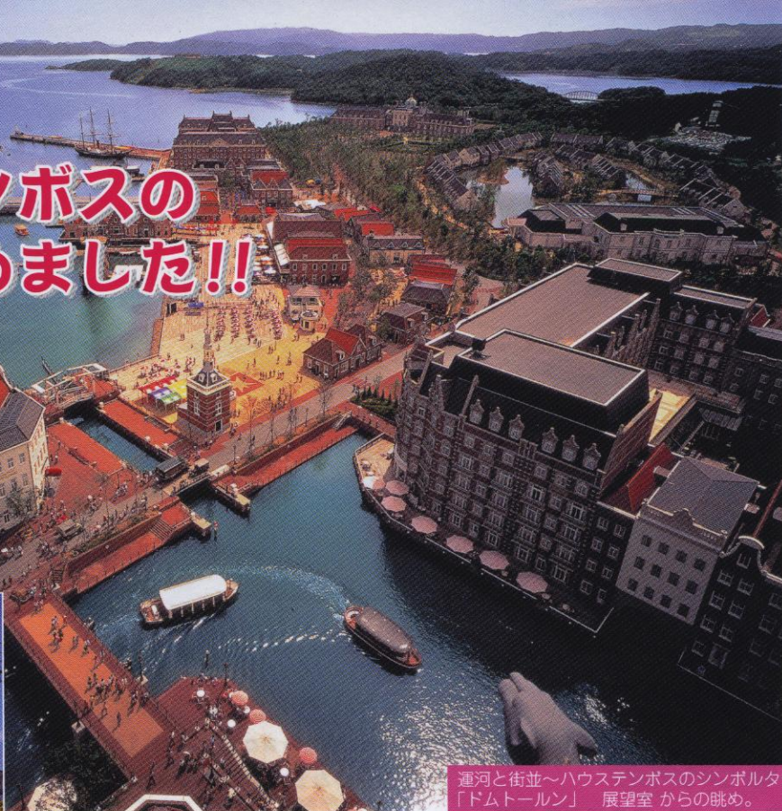
運河と街並～ハウステンボスのシンボルタワー「ドムトルン」 展望室からの眺め。

九州の代表的なアミューズメントスポットとして全国的にも有名な長崎ハウステンボス!!施設では四季折々に美しい花々で彩られた異国情緒あふれる情景を楽しめると共に、ご家族でも楽しめる様々なアミューズメント・美術館・博物館などが盛り沢山です。