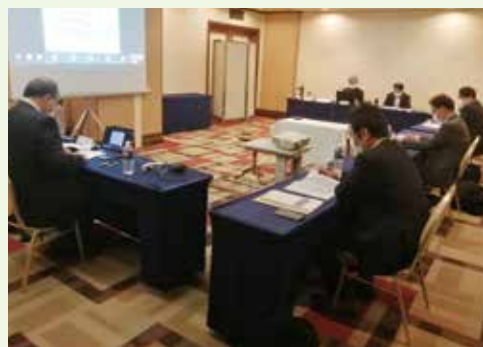
(現地への出席とWEB会議をあわせて開催)

事業主の皆さま、組合員の皆さまにおかれましては、引き続き健保組合へのご理解、ご協力を賜りますようお願い申し上げます。